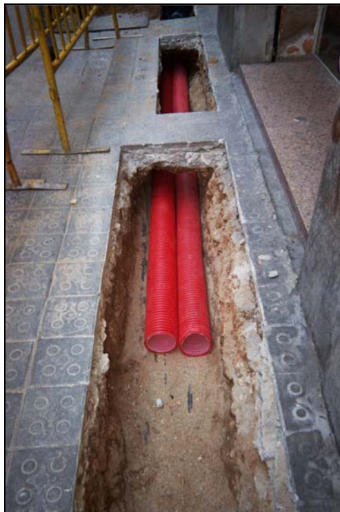
Fotografia 6: Col·locació tubulars per on han de passar els cables elèctrics.