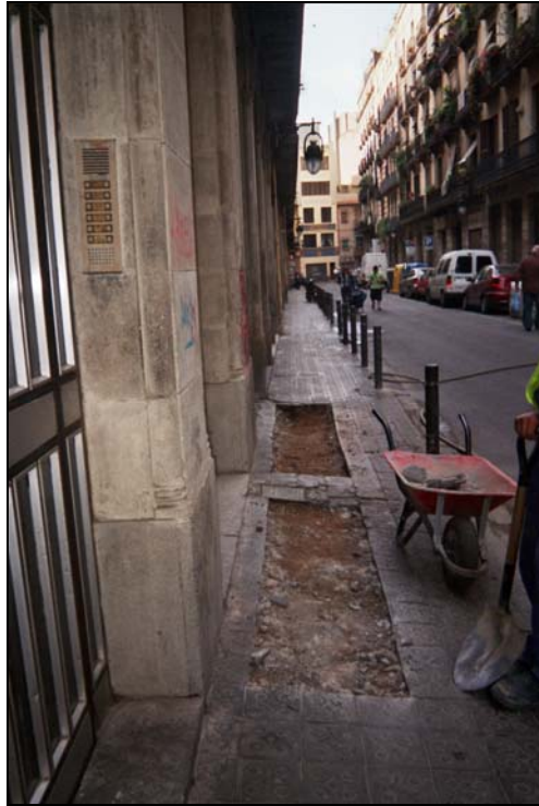
Fotografia 3: Obertura de la rasa 100.