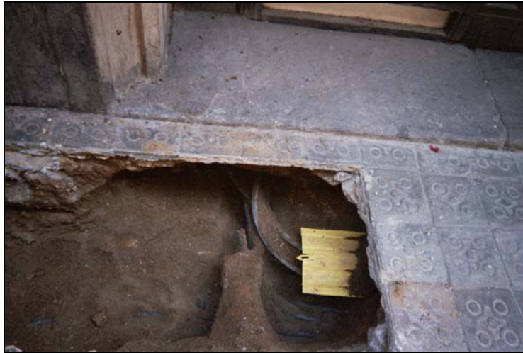
Fotografia 5: Entrada finca número 19 on hi ha unitat transformadora.