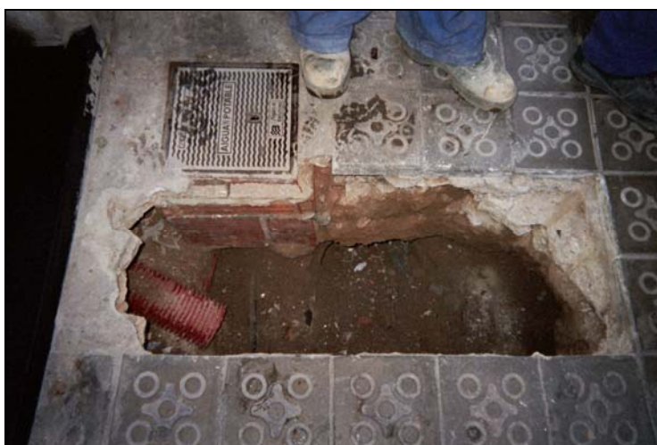
Fotografia 2: Sondeig amb tubulars de la finca.