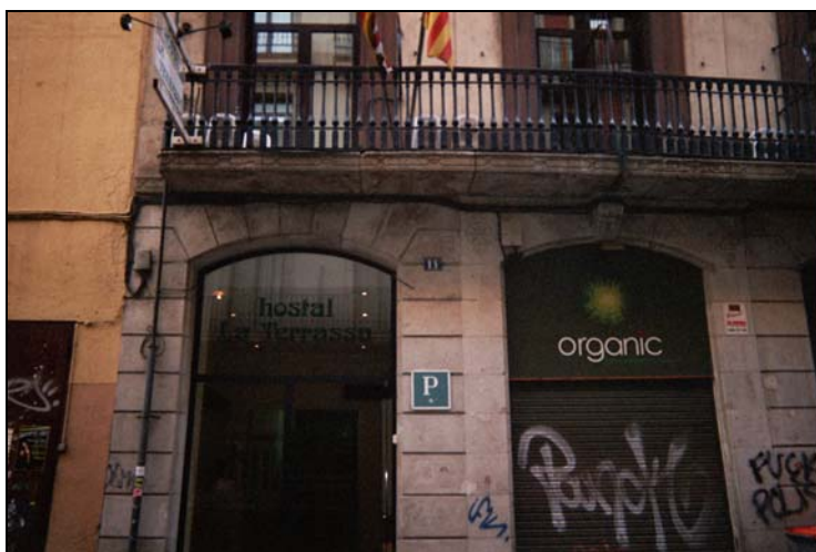
Fotografia 1: Finca Junta de Comerç 11 on s'ha de portar la nova línia.