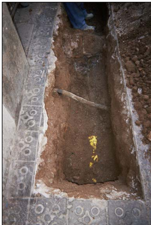
Fotografia 4: Estrat de sauló UE 103 amb diversos serveis.